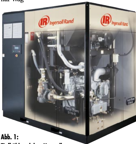
Abb. 1: Tiefkühlprodukte-Hersteller Wagner arbeitet mit Ingersoll Rand zusammen und setzt deren ölfreie Sierra-Schraubenkompressoren ein.

Mit einem Umsatzanteil von 33% im deutschen Markt ist Wagner im saarländischen Nonnweiler einer der größten Hersteller von Tiefkühlpizzas in Europa. 1969 wurde das Unternehmen gegründet, 1985 führte der Unternehmensgründer die „Original Wag-