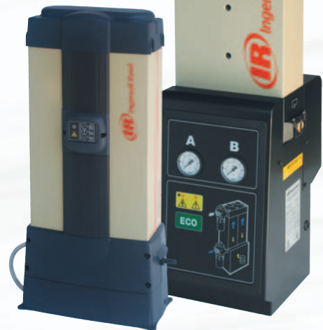
D411M - D2991M Modulare Adsorptionstrockner